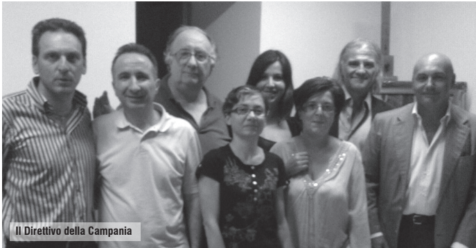
Il Direttivo della Campania