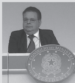
Il Presidente G. Trieste a Palazzo Chigi

Sotto l'Alto Patronato del Presidente della Repubblica Giorgio Napolitano, FIABA, la Fondazione Italiana per l'Abbattimento delle Barriere Architettoniche, nella ricorrenza del FIABA DAY 2013, a Roma, il 2 ottobre, ha indetto una conferenza stampa a Palazzo Chigi.