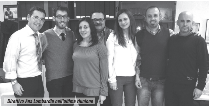
Direttivo Ans Lombardia nell'ultima riunione