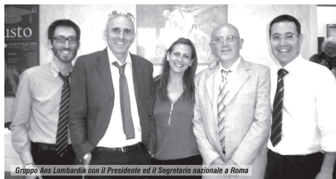
Gruppo Ans Lombardia con il Presidente ed il Segretario nazionale a Roma